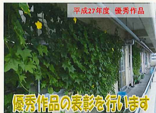
平成27年度 優秀作品