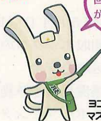
スリムヨコハマ 3R 夢！マスコット イーオ