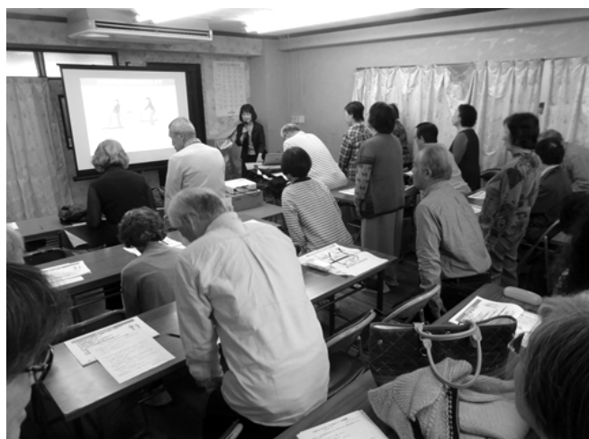
(写真は昨年10月の講座。途中で軽い体操も。)

講師派遣費用、保険料及び講座案内チラシの作成は磯子地域ケアプラザが、会場使用料等を自治会が負担するという計画です。