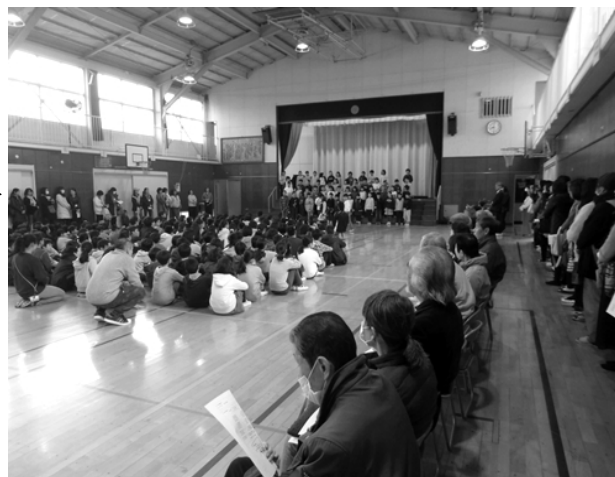
(2月25日(月)の4、5年生の発表の様子)

次回は3月11日(月)朝8時20分から、卒業生を送る会で歌う曲の演奏とのこと。皆さん誘い合わせて聴きに行きましょう。