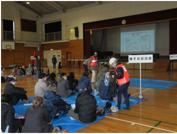
浜小学校防災拠点訓練