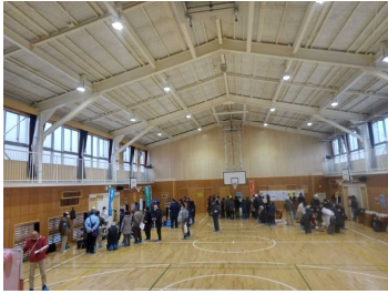
山王台小学校防災拠点訓練

山王台小学校地域防災拠点は1月21日(日)10時から、浜小学校地域防災拠点は1月28日(日)10時30分から「地震が発生し、家屋の倒壊等被害を受けた地域住民が防災拠点に円滑に避難し、防災拠点が開設できるよう、実際に即した拠点開設・運営訓練」を行いました。