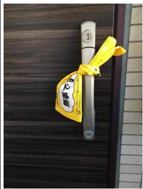
災害時安否確認バンダナ 使用例