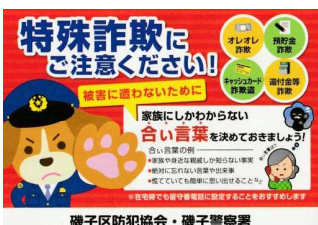
磯子区防犯協会・磯子警察署

3月末までの磯子区内の火災発生件数は9件で、前年同期と比べ7件の減少となっています。市内全体では、209件の火災が発生しており、前年同期に比べ35件の減少となっています。