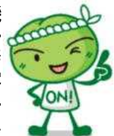
磯子区地域福祉保健計画の案内役「梅さん」

☎(750)2442 FAX(750)2547 E-mail: is-fukuhokkeikaku@city.yokohama.lg.jp