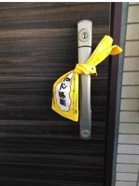
災害時安否確認バンダナ 使用例